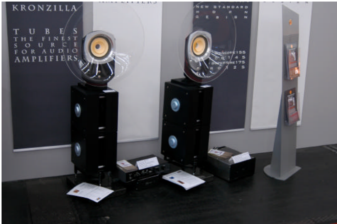
Vor der Fa. GREATech: der AudioFly minivac , die kleinste Röhre der HighEnd, zu Besuch bei der größten, Kronzilla, auf unserem Stand.